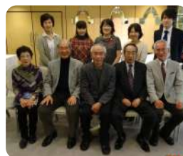
医療衛生学部の皆さん