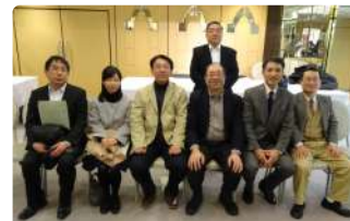
獣医学部・医学部の皆さん